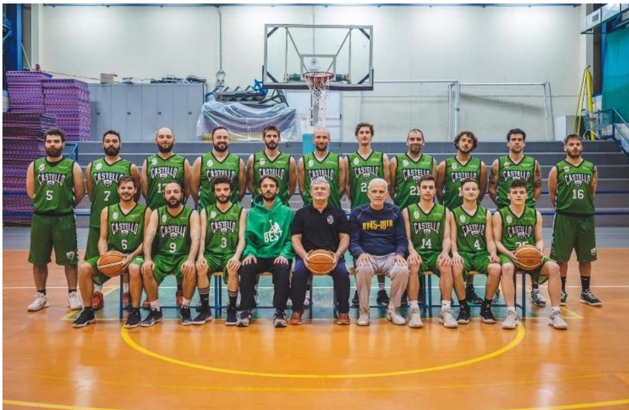
IL GRUPPO DEL BASKET PARTECIPANTE AL CAMPIONATO FIP DI PROMOZIONE 2018-2019

Il settore Pallacanestro, il gruppo del Basket , cenerentola della Società in termini di affiliazione, ultima realtà entrata a far parte dell'Atletica Castello, partecipa oggi al Campionato FIP di Promozione e al Campionato UISP. Con particolare riguardo alla formazione tecnico-sportiva, sempre complementare a quella socio-educativa, si tengono annualmente corsi di Minibasket per bambini dai 5 agli 8 anni, mentre periodiche e costanti sono le iniziative benefiche mirate , su scala provinciale e regionale.