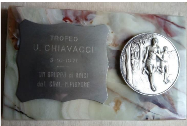
LA TARGA DONATA DAL "GRUPPO AMICI DI UGO DEL CRAL NUOVO PIGNONE" ALLA PRIMA SQUADRA CLASSIFICATA ALLA PRIMA EDIZIONE DEL TROFEO CHIAVACCI