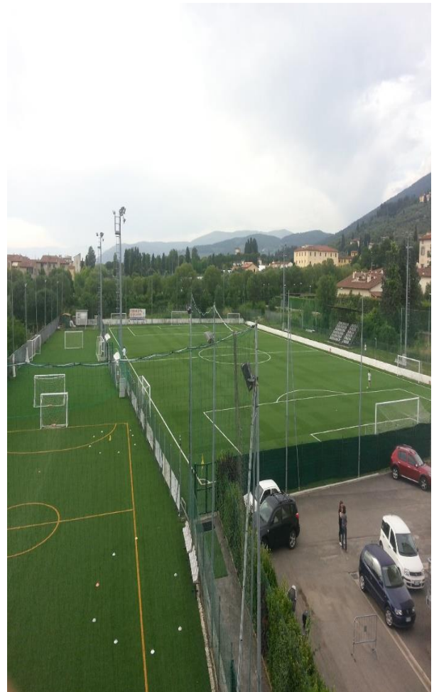
IL NUOVO MANTO "SINTETICO"