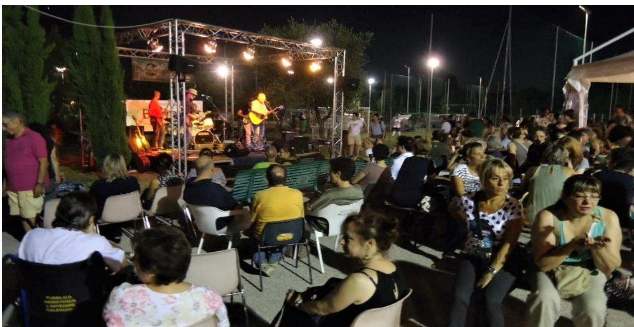
UNO SCORCIO DELL'ARENA SPETTACOLI DELL'AREA "OASI DEI GOLOSI" DURANTE UNA FESTA BIANCOVERDE DEGLI ULTIMI ANNI

Si arriva al 1991, ha inizio la Guerra del Golfo tra Iraq e Kuwait; in Sudafrica il governo abolisce le ultime leggi razziali ancora in vigore mettendo ufficialmente termine all'Apartheid; Riccardo Cocciante vince il Festival di San Remo e al cinema si "Balla coi lupi" vincitore di 7 Oscar; a Genova a causa dell'esplosione a bordo della petroliera Haven sono sversate in mare 144.000 tonnellate di greggio; viene ufficialmente sciolto il Patto di Varsavia; a Bari sbarca il mercantile Vlora carico di 12.000 profughi albanesi; ha termine ufficialmente l'URSS con le dichiarazioni di indipendenza delle singole repubbliche; sul ghiacciaio del Similaun, sul versante italiano al confine fra Italia ed Austria, viene ritrovato un uomo – ritenuto un cacciatore – vissuto 5.000 anni fa, dal corpo mummificato: verrà ribattezzato la mummia del Similaun o, più familiarmente, Ötzi;