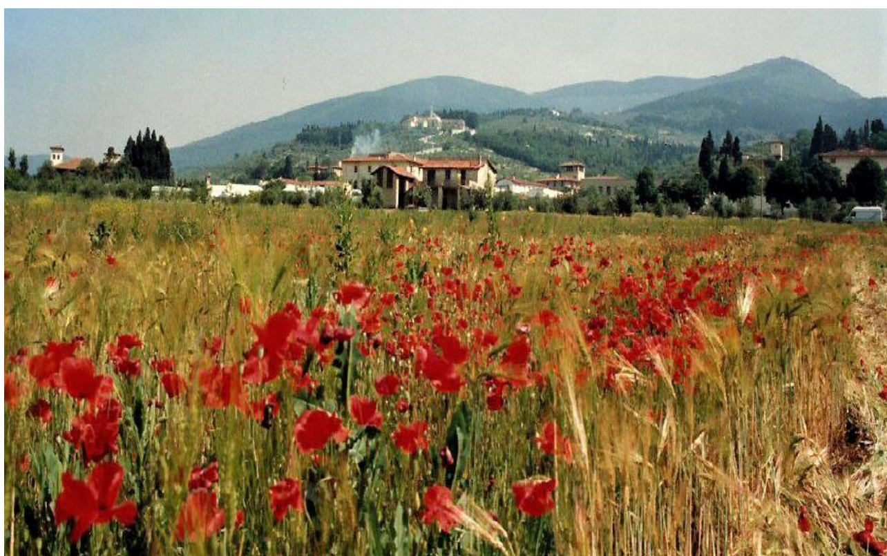
IL TERRENO DOVE SORGE IL PARCO DELL'ATLETICA CASTELLO COSI' COME APPARIVA AL MOMENTO DELL'ACQUISTO DEL PRIMO LOTTO. UN CAMPO DI FRUMENTO CON UNA STRISCIA DI PAPAVERI LUNGO IL VIOTTOLONE

l'Inter vince il Campionato Italiano di calcio per la 16ª volta ed è tutta inglese la finale della 53ª edizione della Champions League allo Stadio Luzhniki di Mosca dove il Manchester Utd vince per la terza volta il trofeo, imponendosi ai rigori contro il Chelsea; Rafael Nadal batte Roger Federer (campione in carica da cinque anni) a Wimbledon, in una finale epica (6-4,6-4,6-7,6-7,9-7) - 4 ore e 48 minuti per la finale più lunga di sempre- ; lo Sporting Braga vince l'ultima edizione della Coppa Intertoto; Alessandro Ballan è Campione Mondiale di Ciclismo e Cristiano Ronaldo con la maglia del Manchester United vince il suo primo Pallone d'Oro. L'etiopie Kenenisa Bekele alle Olimpiadi è medaglia d'oro sui 10000 e i 5000; La Mens Sana Siena continua a vincere lo scudetto nel Basket, mentre Trento è Campione d'Italia nel Volley; a Pechino Federica Pellegrini, nei 200 m stile libero conquista la sua prima medaglia olimpica; l'eritreo Zersenay Tadese è primo sul traguardo della Cinque Mulini.