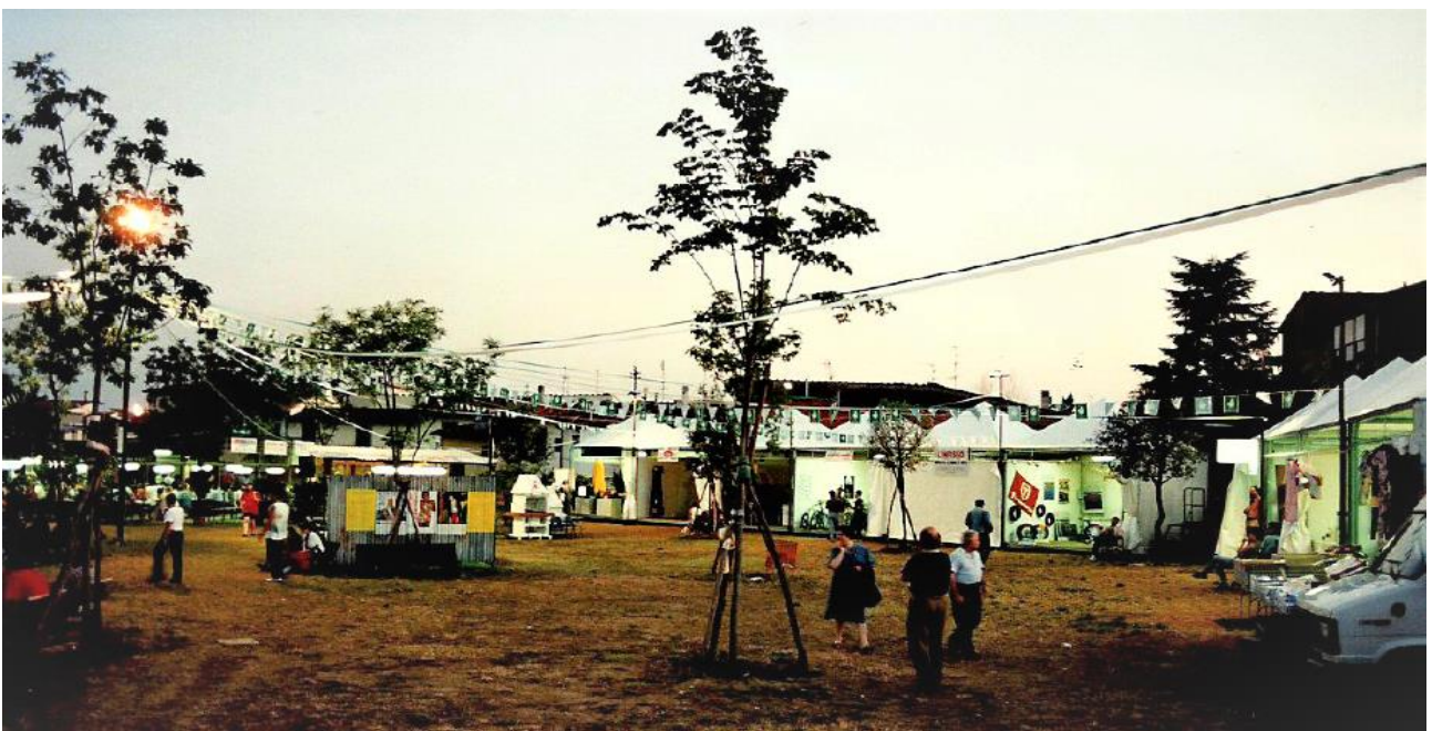
UNA VISTA GENERALE DI UNO DEI PRIMI ALLESTIMENTI “INTERNI” DELLA FESTA BIANCOVERDE

Siamo nella tarda primavera del 1988. Con “Perdere l’amore” Massimo Ranieri aveva vinto il Festival di Sanremo; Pininfarina diventa il nuovo Presidente di Confindustria; l’“Ultimo Imperatore” di Bernardo Bertolucci trionfa con 9 statuette alla notte degli Oscar; in URSS viene riconosciuta la libertà di culto; in Francia Francois Mitterrand è rieletto Presidente della Repubblica; a Torino si svolge la prima edizione del Salone del Libro; il Segretario di Stato Vaticano monsignor Agostino Casaroli è ricevuto al Cremlino da Mikhail Gorbacev; Achille Occhetto è il nuovo segretario del PCI; a Bologna si tiene l’ultimo concerto in pubblico del Quartetto Cetra. Sono arrestati per l’omicidio Calabresi gli ex leaders di Lotta Continua Adriano Sofri, Giorgio Pietrostefani e Ovidio Bompresi. Per la strage di Bologna Vengono condannati all’ergastolo gli estremisti neri Valerio Fioravanti e Francesca Mambro. La Juventus è insignita della Targa Uefa quale primo club europeo ad aver vinto tutte le competizioni continentali. In Adriatico dilaga la mucillaggine; Maurizio Fondriest vince il Campionato del Mondo di Ciclismo; muore Enzo Ferrari e la Rossa, dopo 10 anni, vince il Gran Premio d’Italia a Monza;