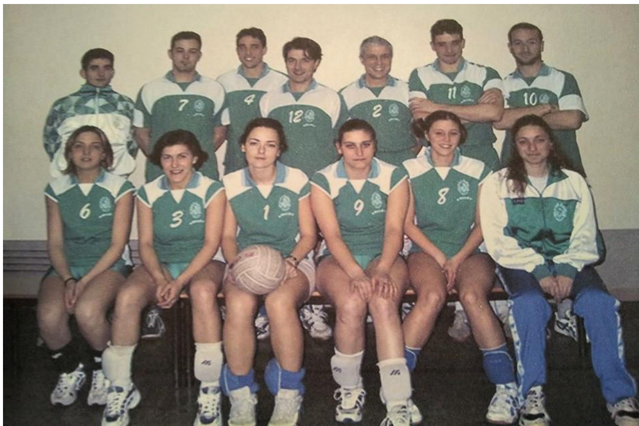
LA PRIMA SQUADRA UFFICIALE “ATLETICA CASTELLO VOLLEY” DEL 1995

“nella mia carriera pallavolistica ho lasciato tante squadre, ma mai una squadra-famiglia”. In quel momento ho realizzato di aver raggiunto quanto ci eravamo prefissi intraprendendo questo sport tanti anni fa. Quelle parole mi hanno fatto capire di aver raggiunto e vinto il trofeo più grande che esista: divertirci tra amici creando un legame familiare, quella Famiglia che abbiamo costruito e trovato sotto i colori Bianco-Verdi dell’Atletica Castello. - Con il nome “Compagni di Merende” i primi approcci e dal 1995 ufficialmente “Atletica Castello Volley”.