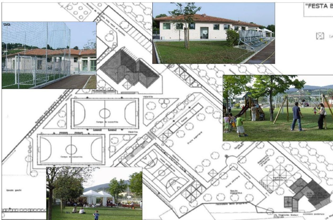
PLANIMETRIA DEL PARCO CON IL LAY OUT DELL'ALLESTIMENTO DELLA FESTA BIANCOVERDE

E' il 1990, a Pisa viene chiuso l'accesso alla Torre Pendente per motivi di sicurezza; in Virginia Douglas Wilder è il primo politico afroamericano eletto Governatore; a Berlino migliaia di cittadini assaltano il quartier generale della Stasi per impadronirsi degli archivi segreti dell'ex DDR, mentre a Mosca apre il primo McDonald's in Russia; in Sudafrica viene liberato Nelson Mandela dopo 28 anni di carcere ed eletto Vicepresidente dell'African National Congress; alla Bolognina Achille Occhetto annuncia la nascita del PDS - Partito Democratico della Sinistra; la quarantesima edizione del Festival di Sanremo è vinta dai Pooh con "Uomini Soli"; l'OMS elimina la voce omosessualità dalla lista delle malattie mentali nella classificazione internazionale delle malattie; viene stipulata la Convenzione degli Accordi di Schengen; in Italia prendono via i Mondiali di Calcio poi vinti dalla Germania che batte in finale l'Argentina di Maradona.