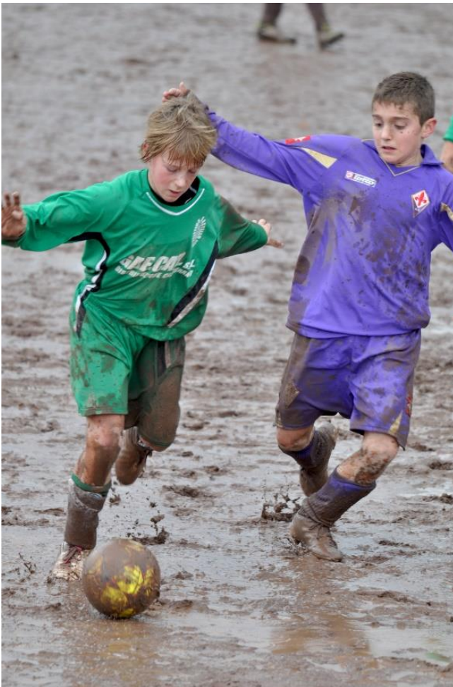
IL VECCHIO MANTO "TERROSO"