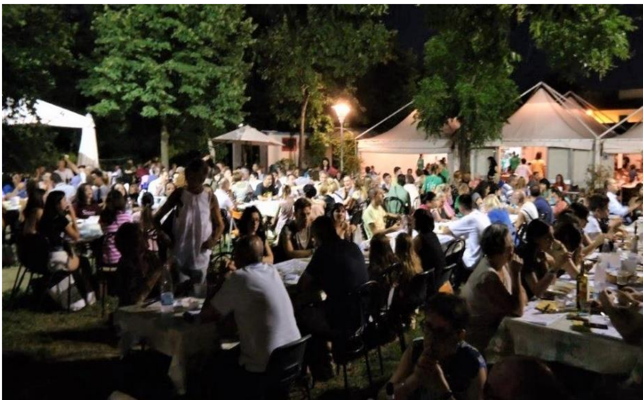
UNO SCORCIO DEL "GIARDINO RISTORANTE" DURANTE UNA ODIERNA FESTA BIANCOVERDE

Con la 4 a edizione del '91 per la prima volta si aprono le porte all'interno della Sede, sul terreno recentemente acquistato, e questa è un'altra storia.