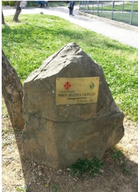
IL CIPPO A RICORDO DELL'INAUGURAZIONE DEL PARCO AVVENUTA IL 20 SETTEMBRE 2008

Fidel Castro annuncia la propria rinuncia all'incarico di presidente e di capo delle forze armate di Cuba. Gli succede il fratello Raúl; a Londra, il conservatore Boris Johnson succede al laburista Ken Livingstone nella carica di sindaco della città; il parlamento norvegese approva a larga maggioranza la legge che rende legale il matrimonio tra persone dello stesso sesso; la Spagna vince gli Europei di calcio battendo a Vienna la Germania 1-0 con gol di Fernando Torres. Hanno inizio in Cina le Olimpiadi 2008; Adriano Malori a Varese diventa Campione del Mondo di ciclismo nella cronometro maschile under 23 e Valentino Rossi vince per l'ottava volta il mondiale di motociclismo aggiudicandosi la vittoria del Gran Premio del Giappone davanti a Casey Stoner. Alle elezioni presidenziali negli Stati Uniti il senatore Barack Obama è eletto 44° Presidente degli Stati Uniti d'America, il primo afroamericano nella storia a ricoprire questa carica; inizia in Zimbabwe un'epidemia di colera che farà quasi 1.200 vittime. Al Sei Nazioni di rugby vince il Galles, l'Italia batte la Scozia ma arriva comunque ultima;