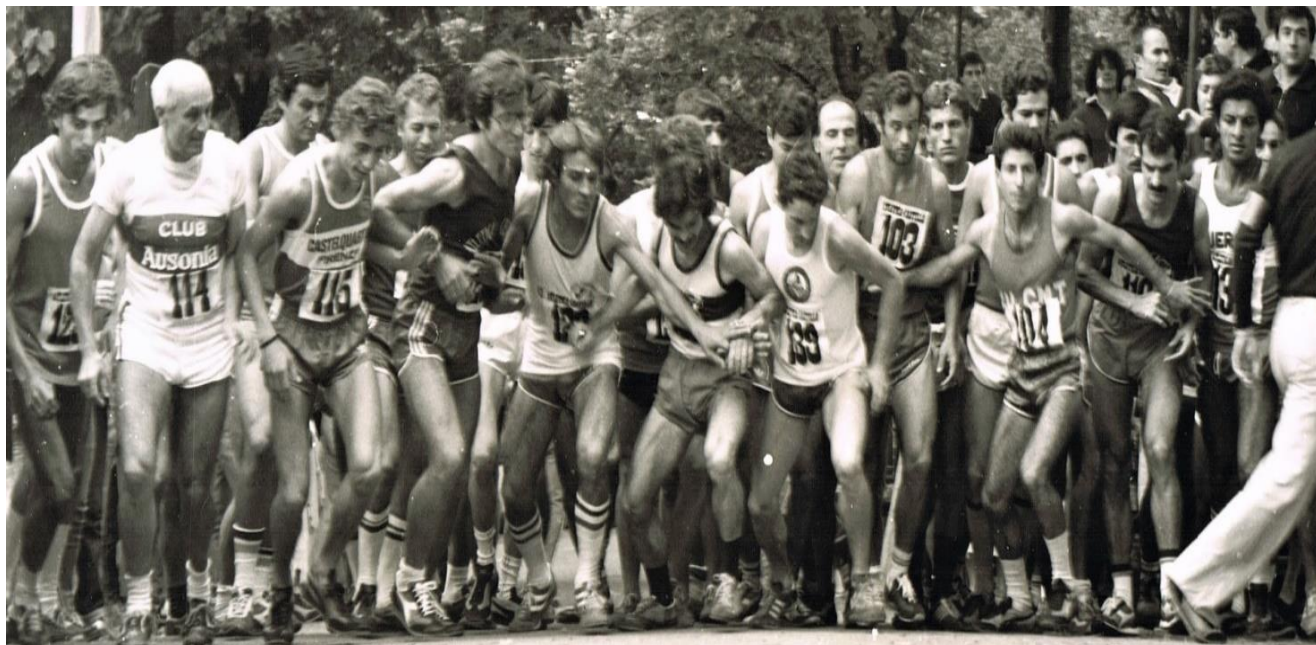
AFFOLLATA PARTENZA DELLA PRIMA FRAZIONE IN UNA DELLE PRIME EDIZIONI DEL TROFEO UGO CHIAVACCI

IL TRACCIATO DEL "TROFEO CHIAVACCI". LA MANIFESTAZIONE FORTEMENTE ISPIRATA ALLA "CINQUE MULINI", MUTUÒ DA QUESTA ANCHE LA VOLONTÀ DI ATTRAVERSARE MATERIALMENTE SPAZI RURALI DI LAVORO NEL CONTESTO CAMPESTRE DEL PERCORSO. A SAN VITTORE OLONA DI SCENA SONO LE STRUTTURE DI 5 MULINI, PERCORSI IN PARTE NEL LORO INTERNO, TRA I RIGOLI D'ACQUA E I PASSAGGI COPERTI; QUI, ALLE PENDICI DI MONTE MORELLO, FURONO INDIVIDUATE DELLE STRUTTURE COLONICHE ANCORA FUNZIONANTI ED OPERATIVE CHE I CONCORRENTI-ATLETI AVREBBERO DOVUTO ATTRAVERSARE, SOPRA LE AIE DAVANTI AI CASOLARI, TRA I FIENILI E LE STALLE, COINVOLGENDO, COME NELLA CINQUE MULINI, I CONTADINI RESIDENTI, GLI AGRICOLTORI-COLONI, GLI ABITANTI IN GENERE.